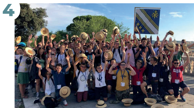
22 AOÛT - Pèlerinage à Rome pour les 24 servants d'autel du diocèse de Reims et des Ardennes