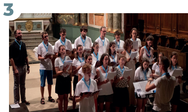
30 JUILLET - Route Chantante de l'aumônerie Ad Altum au départ d'Aix-Les-Bains