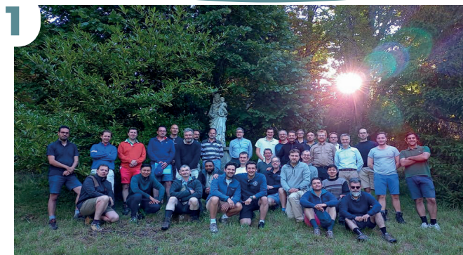
2 JUILLET - Pèlerinage des pères de famille