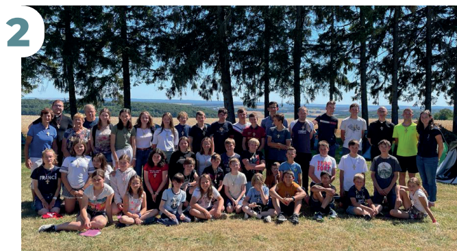
8 JUILLET - 35 jeunes prennent la route à VTT pour le pèlerinage en direction de St Walfroy