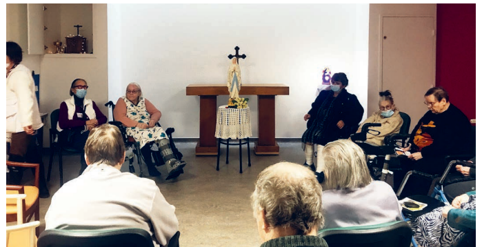
Chapelet du lundi à 15h30 à l'Ehpad Roux